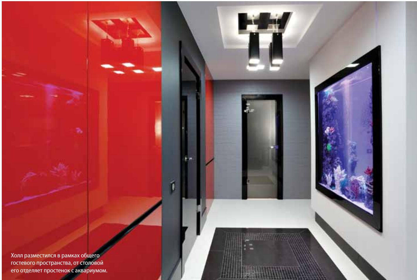
Холл разместился в рамках общего гостевого пространства, от столовой его отделяет простенок с аквариумом.