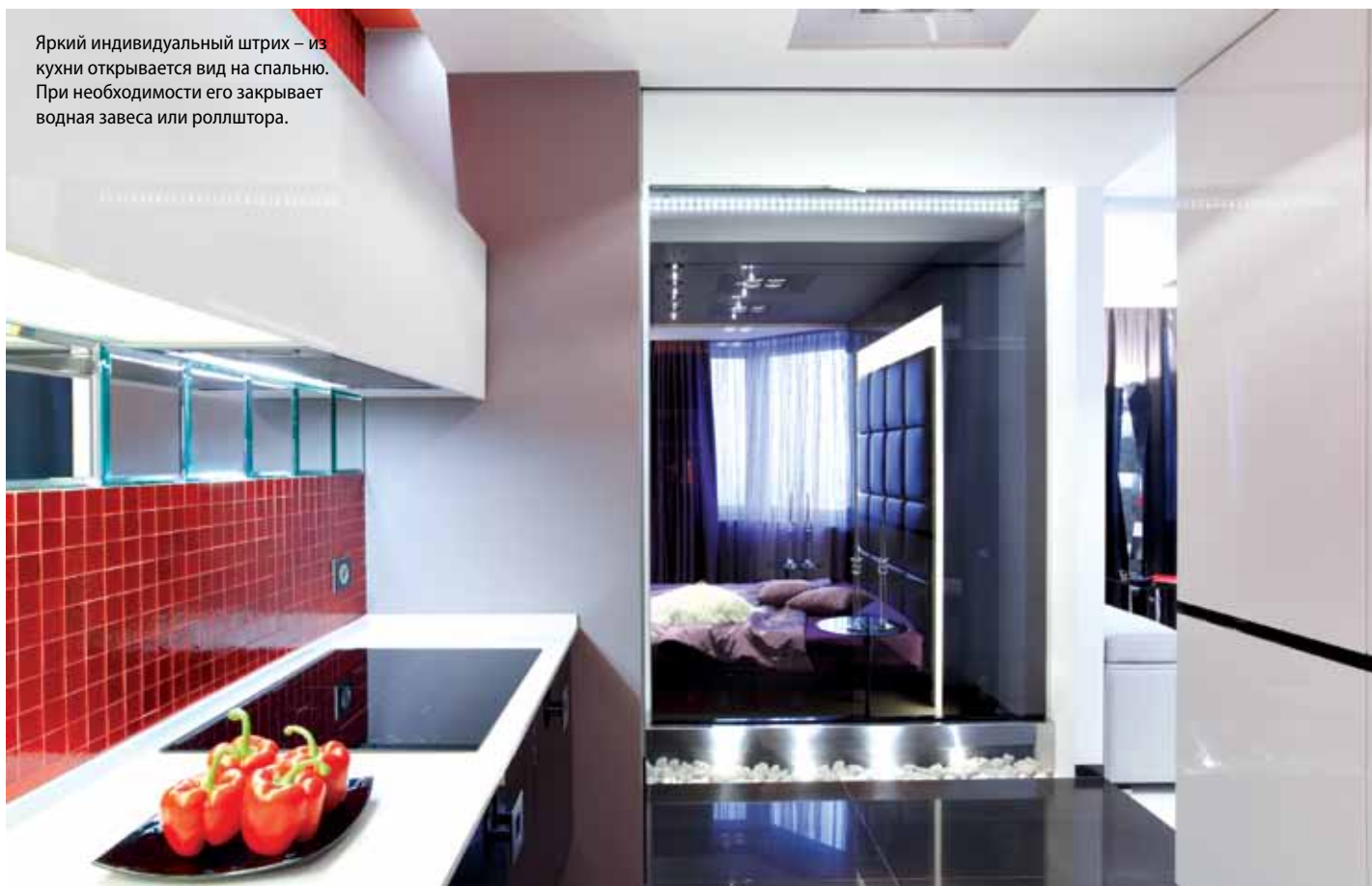
Яркий индивидуальный штрих – из кухни открывается вид на спальню. При необходимости его закрывает водная завеса или роллштора.