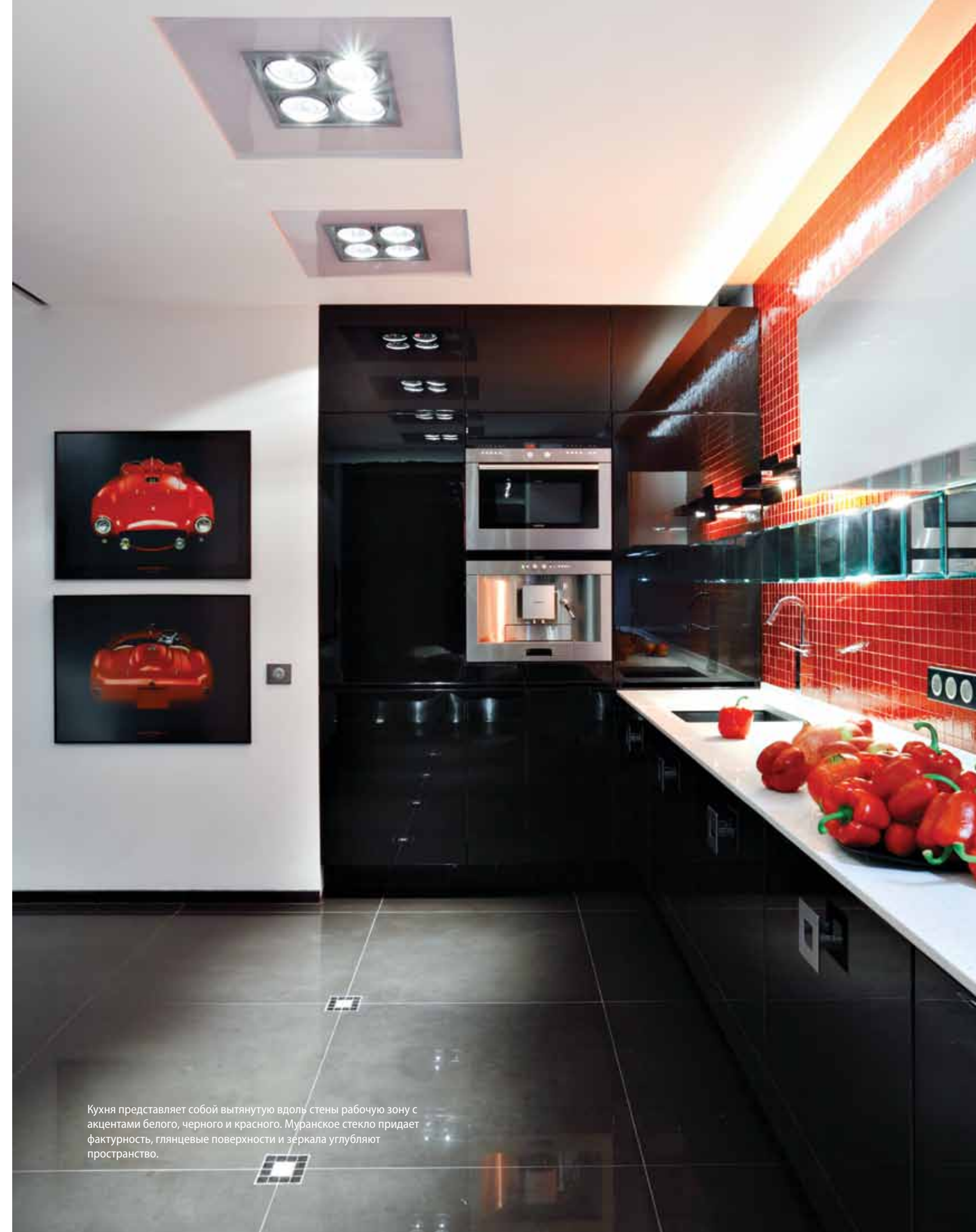
Кухня представляет собой вытянутую вдоль стены рабочую зону с акцентами белого, черного и красного. Муранское стекло придает фактурность, глянцевые поверхности и зеркала углубляют пространство.